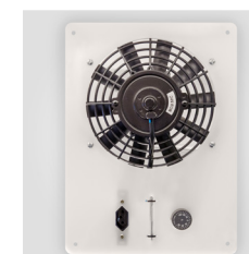
Kit ventilação 12V ou 24V