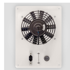
Kit ventilação 12V ou 24V