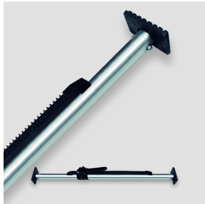
Trava paleta catraca