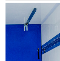
Sistema de movimentação trilho no teto ou lateral