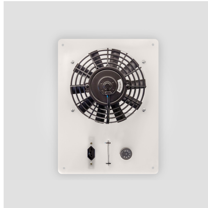
Kit ventilação 12V ou 24V