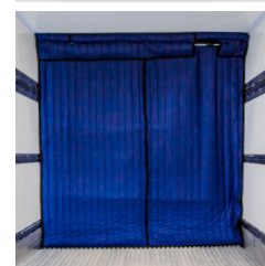
Sistema de abertura tipo porta