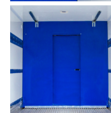
Porta central ou lateral